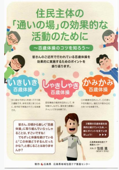
参考：広島県発行パンフレット